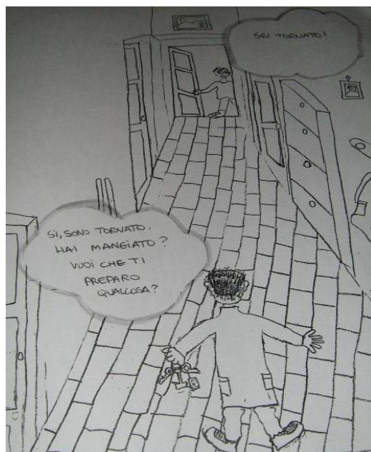
Figura 5. Disegno dell'incontro di un ragazzo cinese con suo padre