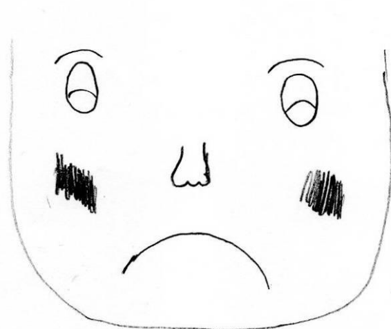
Figura 2. Disegno dell'espressione facciale della vergogna eseguito da ragazzo di cultura italiana

Inoltre, nel confronto fra i segnali espressivi della vergogna nei disegni dei ragazzi cinesi e italiani è emerso che nella cultura cinese, a differenza di quella italiana, la vergogna è intesa anche come una conseguenza del fallimento di rispondere alle aspettative del proprio gruppo di appartenenza, e quindi è sentita come un'esperienza acuta e penosa con un profondo senso di disagio per la grave svalutazione della propria immagine davanti agli altri e per la consapevolezza di aver danneggiato seriamente il proprio gruppo di appartenenza (Anolli, 2000). Le lacrime presenti nel disegno del ragazzo cinese diventano pertanto un indicatore della complessa articolazione della vergogna nella cultura cinese, ove tale esperienza acuta di disagio si può accompagnare alla tristezza. Le emozioni infatti sono eventi 'sentiti', oltre che percepiti, e variano in termini di intensità lungo una traiettoria continua di esperienze presentandosi non come categorie chiuse ma come famiglie i cui componenti, in parte simili e in parte diversi, possono dare luogo al fenomeno secondo il quale un'emozione genera essa stessa subito un'altra emozione, creando il cosiddetto 'ciclo' ( loop ) emotivo (Anolli, 2002).