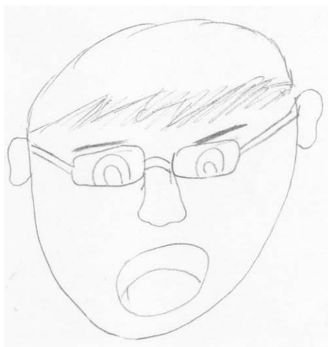
Figura 4. Disegno dell'espressione facciale della collera eseguito da ragazzo di cultura italiana