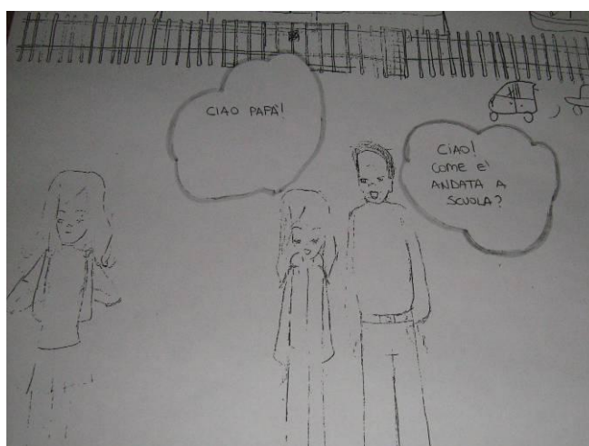
Figura 6. Disegno dell'incontro di una ragazza italiana con suo padre

Questi e altri risultati rappresentano per i ragazzi di entrambe le culture i presupposti per un'effettiva applicabilità concreta dei modelli culturali in situazioni interattive biculturali scolastiche e extrascolastiche.