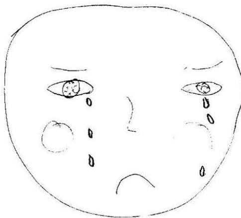
Figura 1. Disegno dell'espressione facciale della vergogna eseguito da ragazzo di cultura cinese

Rispetto all' espressione facciale della vergogna , come emerge dai disegni sotto riportati di un ragazzo cinese e di un ragazzo italiano, è stata condivisa la consapevolezza del fatto che tale emozione presenti un segnale distintivo comune e universale, ossia il rossore delle gote (Casimir e Schnegg, 2003). Tale segnale, considerato da Darwin come 'l'espressione più speciale dell'uomo', compare precocemente nel bambino non appena è raggiunta la consapevolezza di sé, dell'altro, e della situazione e rappresenta una sorta di precursore della coscienza morale, in quanto è conseguenza della percezione di una propria condizione di inadeguatezza. Poiché il rossore non può essere simulato, esso non solo comporta la consapevolezza improvvisa della propria situazione di trasgressione degli standard violati, ma anche rappresenta un'ammissione sincera della propria manchevolezza, che, in quanto visibile (il volto è la parte del corpo più esposta) può ridurre l'ostilità del gruppo e sollecitare l'indulgenza da parte degli altri (Anolli, 2000).